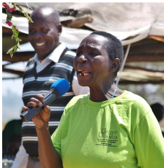
– kan også de gamle stå frem og ta ordet 'in public'