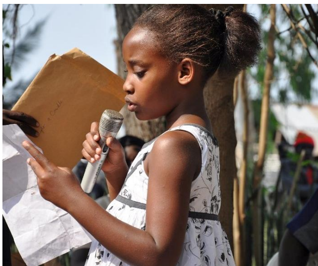
Med de yngste som forbilde

Men så har det altså tatt litt tid før vi fikk 'papiret' i hende. Først må man finne en typisk besvarelse lokalt i Nebbi District, dernest oversette den fra alur til engelsk, også det lokalt, så sende den til henting på bussen ved ankomst Kampala, slik at Mark kan scanne 'dokumentet' og sende det hit.