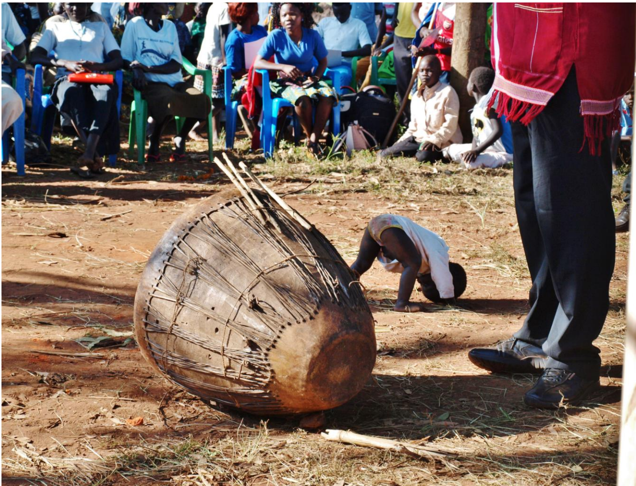
Kunnskap og ferdigheter har mange dimensjoner!