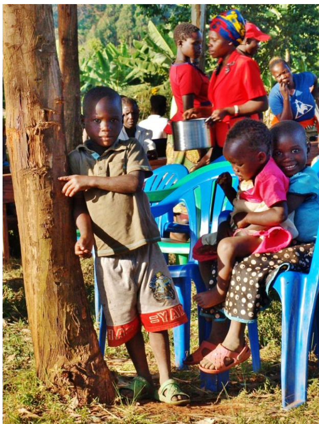
Før pandemien. Fra UPLIFT Graduation i januar 2020. Når skolen begynner, kan mamma hjelpe barna med å lese!

Hvorfor denne ganske enkle observasjon, i et høstbrev til Venner av UPLIFT? Kan det være "at mitt hjerte (og flere, etter at 13 av oss ble litt 'smittet' i Årsmøtet) lenges mot ekvator"? Nærmere bestemt, West Nile-regionen og en ny UPLIFT-festival, slik 'graduation ceremony' pleier å arte seg. Vi fikk bekreftet i Marks siste oppdatering at alle i UPLIFT-familien satser optimistisk på eksamen i slutten av november – og på felles fest Nord-Sør i januar, som før.