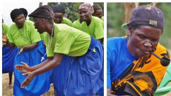
Forsanger – og landsbyklobn

Det andre svaret vil overraske noen: Blant kursdeltakerne finnes også noen fra et nabolandsdistrikt som har deltatt i tidligere år – endog noen som kan ha bestått, men vil ha mer av det gode! Dette har man ikke klart å unngå, men ettersom alle navn er registrert hvert år, vedtok styret å skaffe seg en oversikt over hvor mange 'repeating learners' det kan dreie seg om.