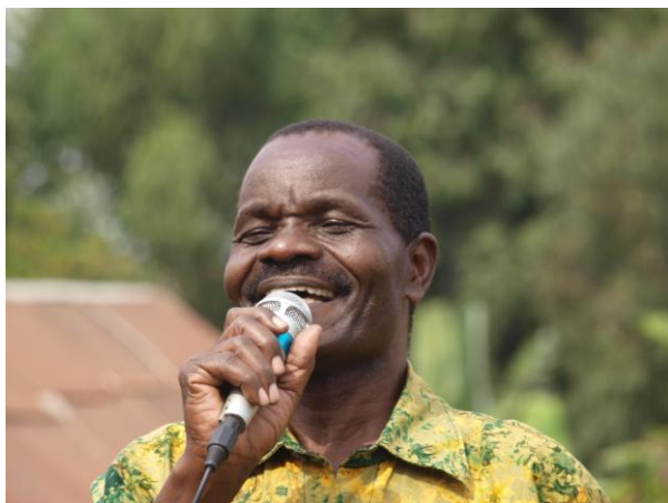
Doctor, or Director, or both – Hizzaya i storform

Det lå et historisk sus i Hizzaya's sammenfatning av UPLIFTs utvikling siden første avgangskull i 2001, og Venner av UPLIFT ble takket spesielt, for så vel økonomisk som moralsk støtte gjennom de siste fire år. Herved er takken overbrakt til alle dere som er venner – av UPLIFT!