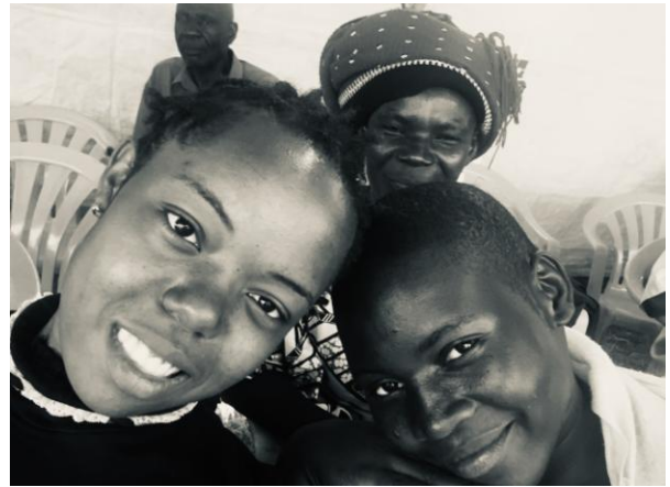
Friendship! Friends of UPLIFT? Oh, yes!

PS: Rapporterte jeg at mat-servering etter programmet pågikk i en time? Kjøtt(knoker) og kylling(bein) tok nok slutt da køen var halvert, men det var plenty annen tung kost! Tung, for nordboere som prøver seg på kalo (google!) – kokt på hirse og kassaava – en hard rødbrun mellomting av potetstappe, lim og gummi [sekretærs subjektive bemerkning].