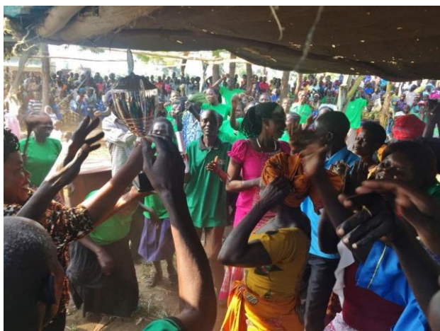
Glede og stolthet – dog mer disiplinert seiersrus enn i 2017!