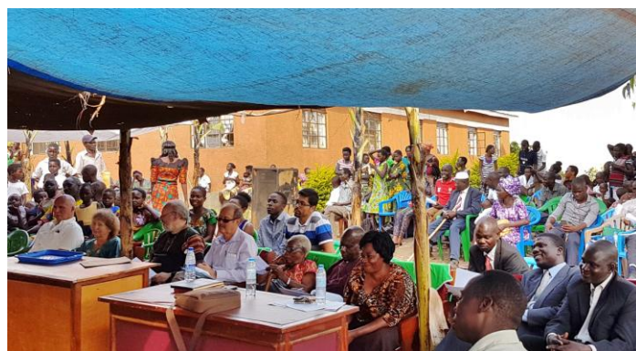
Ringside: Venner av UPLIFT og politikere i Nebbi / Zombo

Og når seremonien begynner, sitter vi ringside skulder ved skulder med fylkesrepresentanter og ordføreren i Erussi Sub-county (kommune).