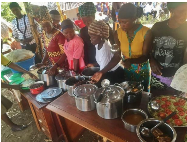
Med mange munnar å mette gikk det med mye mat –