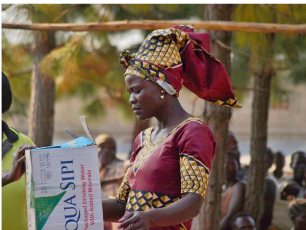
– og mange kartonger med vannflasker ...