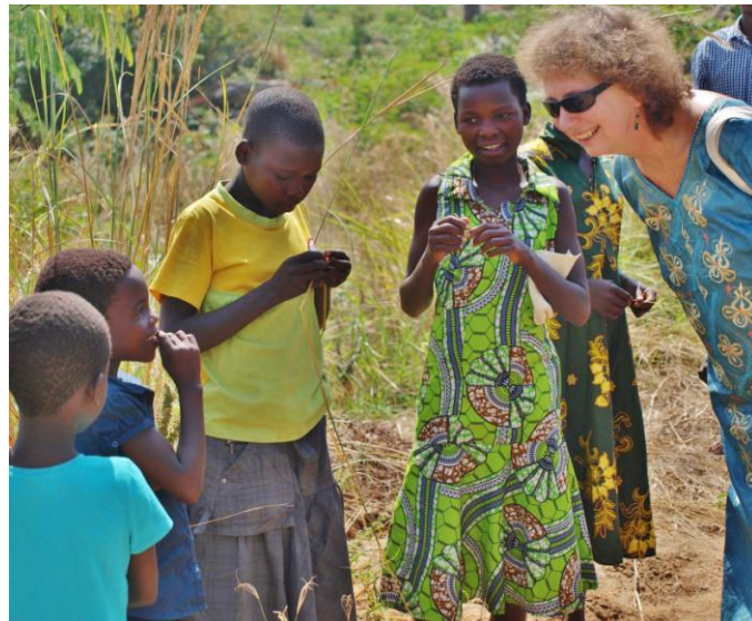
– og noen busspassasjerer i passiar.

De synger flerstemt i bakre del av bussen i to timer. Dette er krydder vi har vennet oss til. Man har da reservehjul, og kyndig reiseleder! Men jeg kan ikke la være å tenke på hvordan 15 barn og 15 voksne frimodig takler en evt. punktering nr. 2 uti ingenmannsland. (Jo, man har da mobiltelefon—men å få tak i en buss?)