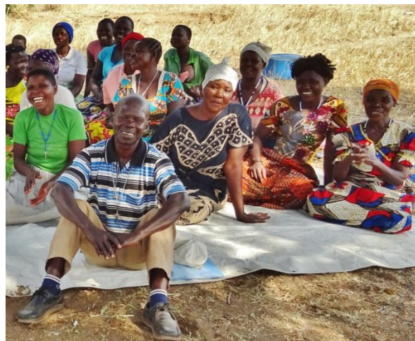
En ganske fargerik håndfull 'learners' i januar i år.

The fever for graduation preparation has already started and it will be held at Erussi town, Nebbi. The graduation will be held on 10 January 2019. This year it seems the graduation will be more colourful than that of last year.