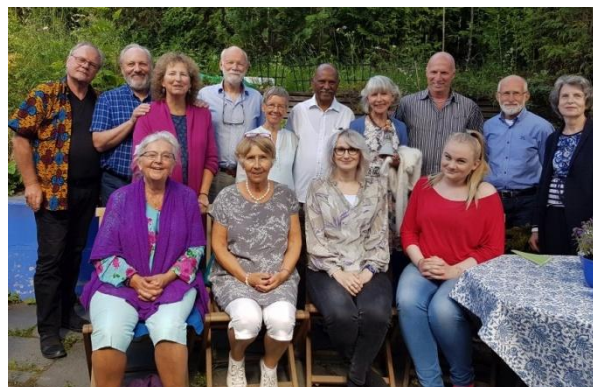
Årsmøtet 16. juni: Det manglet ikke på motiveringen!

Årsmøtet i Lillehammer i juni var livlig med 15 medlemmer og glad stemning. Når jeg nå (stadig i skrivende stund) ser på bildet her ↓ oppdager jeg at 10 av oss har vært i Uganda og deltatt i UPLIFTs graduation ceremony!